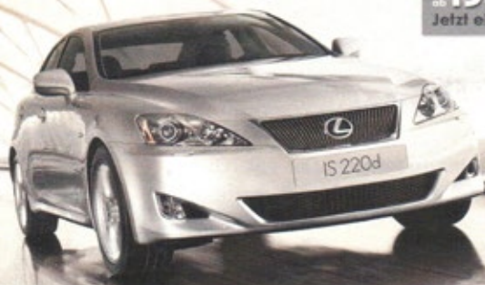
Abbildung ist Symbolfoto. Normverbrauch: 6,3 - 7,4 l/100 km, CO2-Emission: 168 - 195 g/km